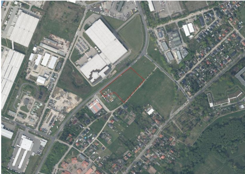
Luftbild mit dargestelltem Geltungsbereich (ohne Maßstab) 2